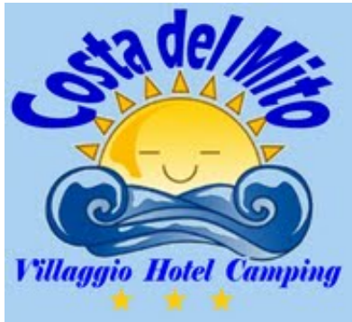
logo costa del Mito.JPG 900K